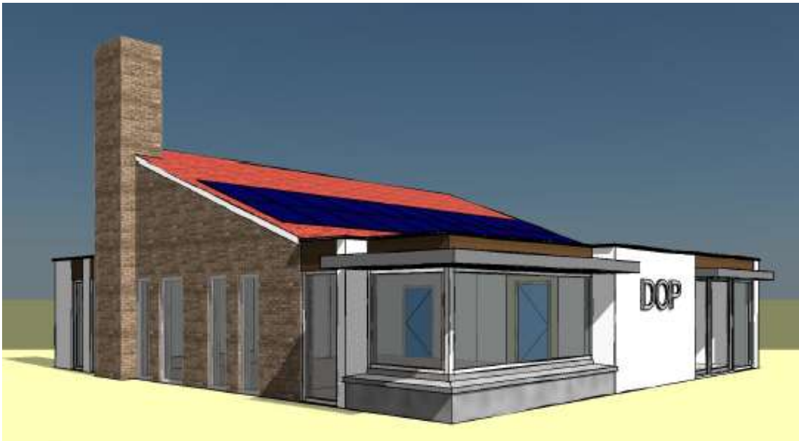
Impressie nieuwbouw DOP-gebouw

De tekeningen van deze nieuwbouw kunnen we mondeling nader toelichten.